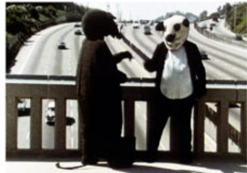
Peter Fischli e David Weiss – The Least Resistance (La via di minor resistenza, 1981)